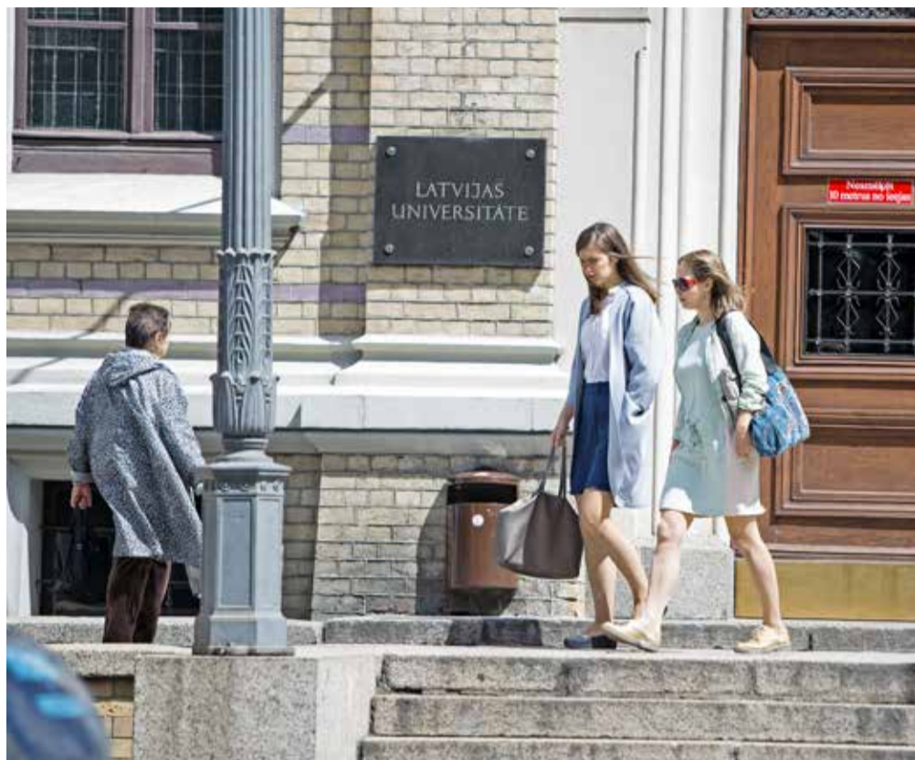
▲ KOPUMĀ studējošo skaits sociālajās zinātnēs, komerczinībās un tiesībās pēdējos gados ir pakāpeniski mazinājies, savukārt dabaszinātnēs un inženierzinātnēs – noturēts nemainīgs ar budžeta vietu palīdzību.